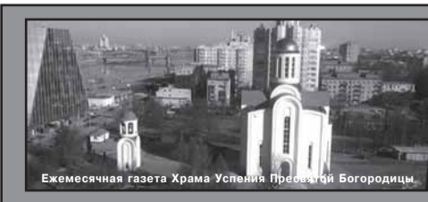
Ежемесячная газета Храма Успения Пресвятой Богородицы.